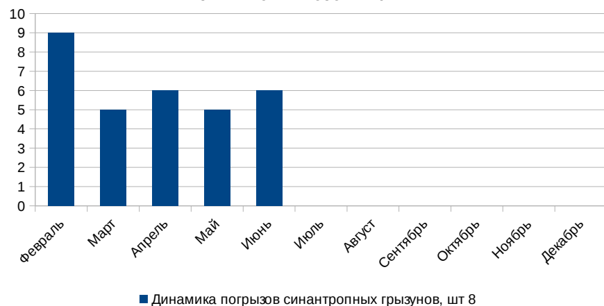
Динамика погрызов синантропных грызунов по третьему контуру защиты, шт