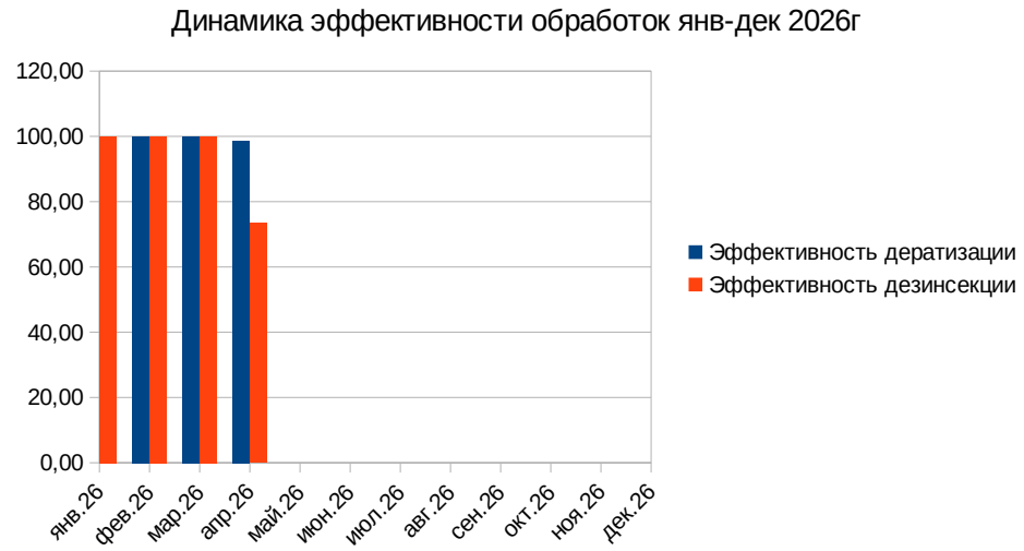
ГРАФИК ЭФФЕКТИВНОСТИ ПЕСТ КОНТРОЛЯ

Соблюдение санитарного режима во всех подразделениях. Обеспечить сохранность средств учета.