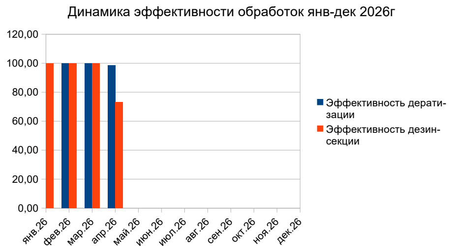
ГРАФИК ЭФФЕКТИВНОСТИ ПЕСТ КОНТРОЛЯ

Соблюдение санитарного режима во всех подразделениях. Обеспечить сохранность средств учета.