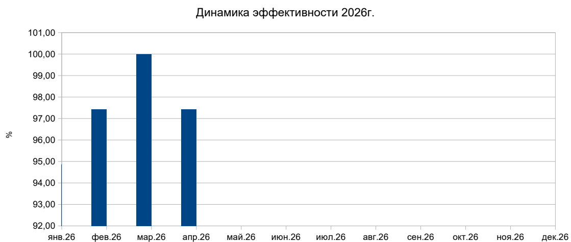
График эффективности по дератизации и дезинсекции Динамика оценки эффективности обработок за период январь 26- декабрь 26г

Соблюдение санитарного режима во всех подразделениях. Обеспечить сохранность средств учета. Проведение санитарной уборки территории (1-2 контур) после полного схода снежного покрова (сбор веток, листвы, бытового мусора, выпревшей травы).