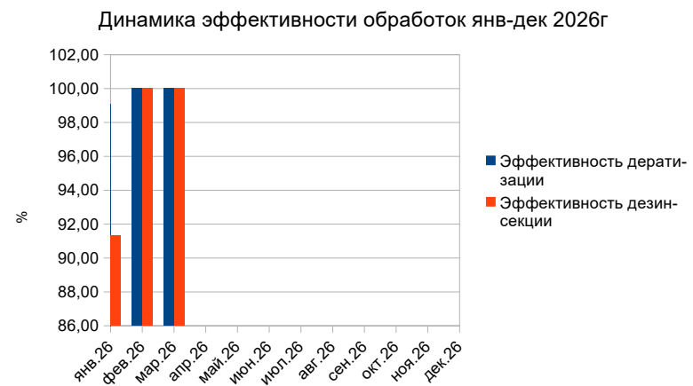
ГРАФИК ЭФФЕКТИВНОСТИ ПЕСТ КОНТРОЛЯ

Соблюдение санитарного режима во всех подразделениях. Обеспечить сохранность средств учета. Проведение снегоуборочных работ на территории (1-2 контур)