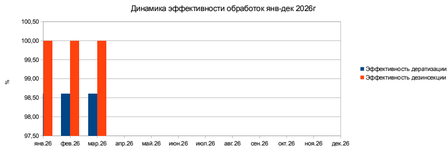
ГРАФИК ЭФФЕКТИВНОСТИ ПЕСТ КОНТРОЛЯ

Соблюдение санитарного режима во всех подразделениях. Обеспечить сохранность средств учета.