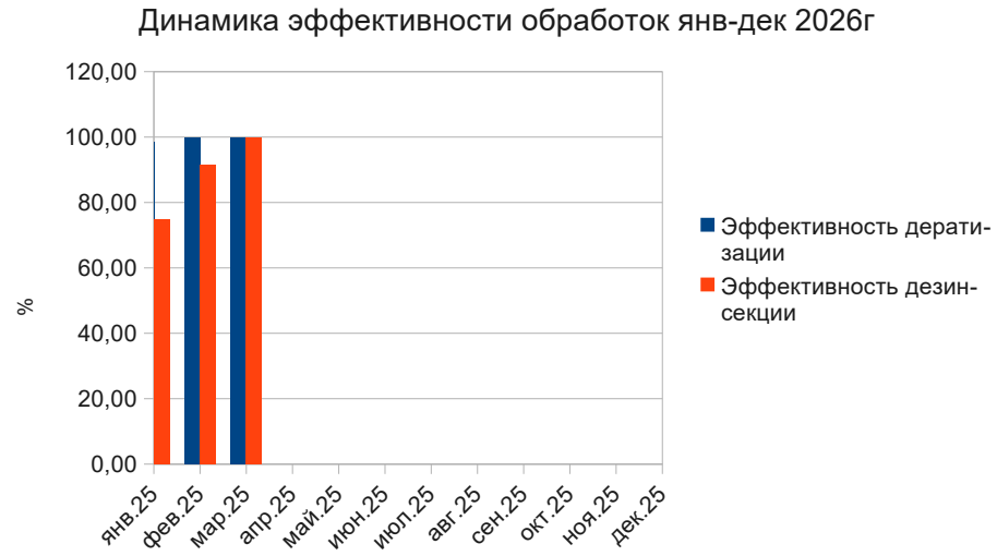
ГРАФИК ЭФФЕКТИВНОСТИ ПЕСТ КОНТРОЛЯ

Соблюдение санитарного режима во всех подразделениях. Обеспечить сохранность средств учета.