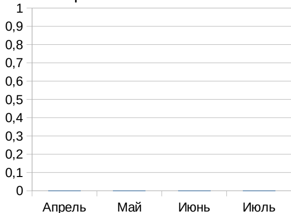
Динамика отлова синантропных членистоногих в шт.